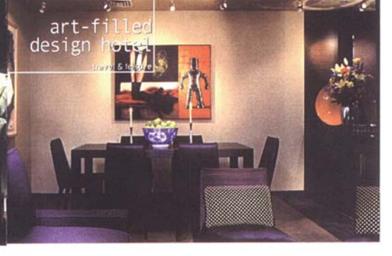
art-filled design hotel travel & leisure